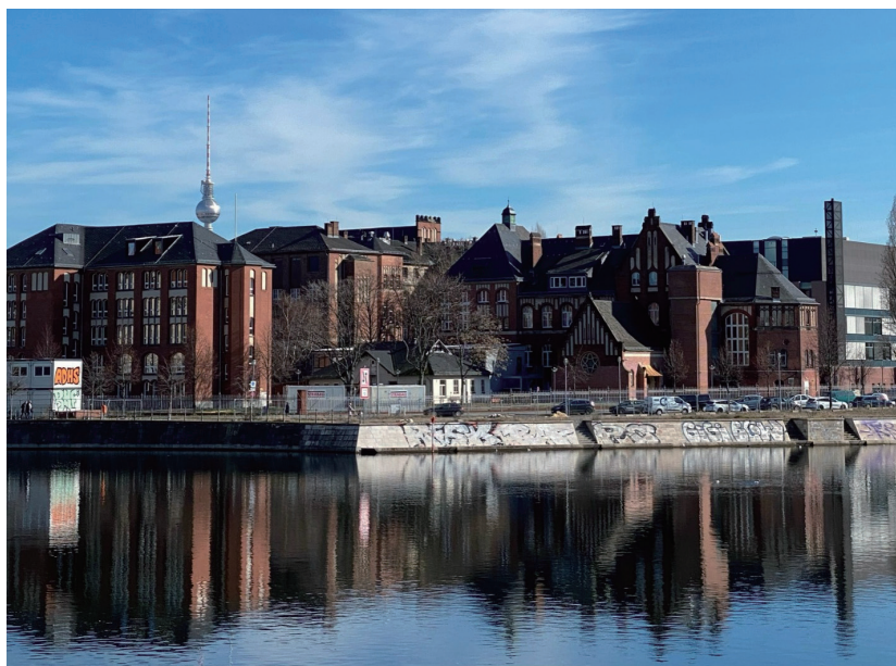
丨坐落于 Spree 河畔的 Charité 医学院米特校区

学生，很认真地倾听学生的想法，很善于引导学生进行思考。不管大事小事，老师们都会征求我们的意见，让我们感受到在这个学术社区里真正被重视，这种亲切的交流方式，让我觉得自己不仅仅是学生，更是这个充满活力的学术社区中的一员。