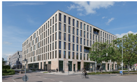
海德堡大学新区教学楼 Mathematikon