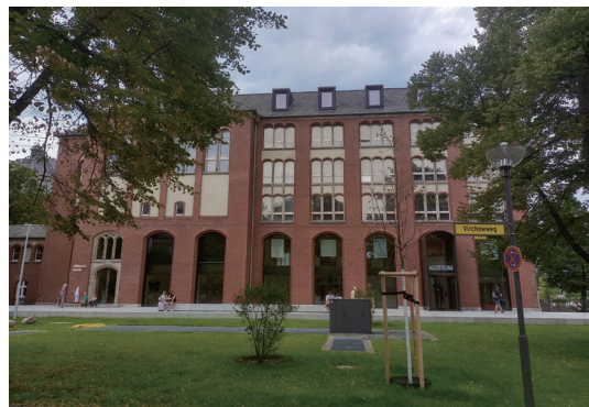
Charité 医学院夏瑞蒂米特校区的医学博物馆

总之，Charité 医学院是一个充满机会和活力的地方。在这里，我们不仅能够接受优质的医学教育，还能够在充满活力的城市中体验到无限的可能。如果你对医学充满热情，那么 Charité 绝对是你不可错过的选择。■