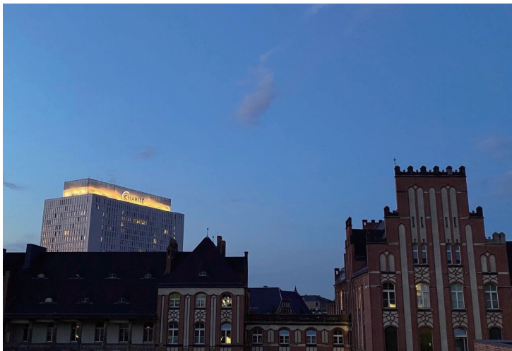
Charité 医学院夏瑞蒂米特校区夜景

历史感，古老的石砖、雕塑和建筑细节仿佛在述说着学术传承的故事。而这一切，都让我深切感受到这所医学院的过去和未来交汇的魅力。坐落于市中心的 Charité，周围环境充满生机，从历史遗迹到现代艺术，从传统市场到创新科技，展现出柏林多元和创意的无限魅力。周末可以约小伙伴逛各种博物馆和展览，有很多可供消遣的去处。