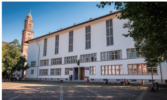
海德堡大学讲堂（老城区，大学广场）

作为德国的旅游城市，海德堡的美景古迹也是少不了的。有位于半山腰曲径通幽的哲学家小径，许多历史上久负盛名的哲学学者都来这里寻找思想的火花。这里不仅有黑格尔的足迹，还见证了大文豪歌德在海德堡的爱情故事。你可以在这里与历史上的大哲学家、诗人进行跨时空的思想碰撞，看着同样的美景，思考同样的问题，瞬间觉得自己都浪漫起来了呢。除此之外还有老城的城堡、桥梁、大学广场旁边的“学生监狱”等，都值得细细品味。欢迎大家有机会来到浪漫优美、典雅沉静又自由洒脱的小城——海德堡。■