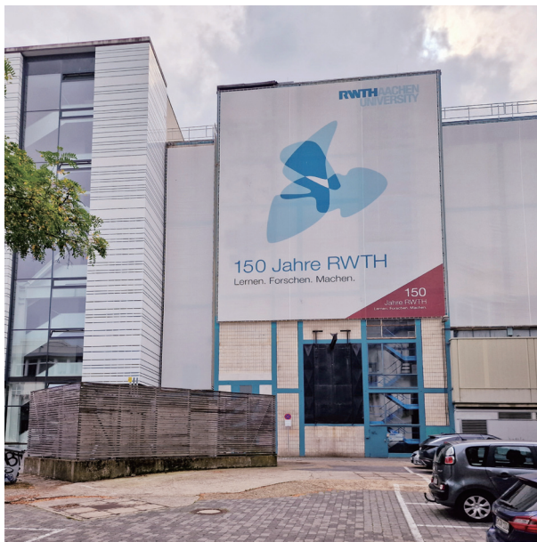
学校 150 周年校庆