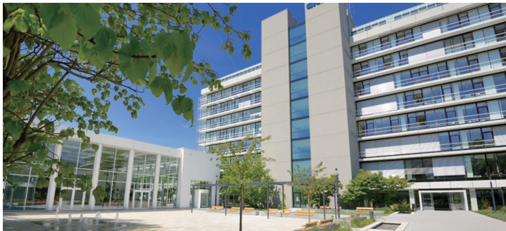
位于海德堡大学新校区的德国国家癌症研究中心 DKFZ 主楼

格是 185 欧元（2023 年 2 月后），可以覆盖附近的大部分城市和小镇，如曼海姆、凯泽斯劳滕等。