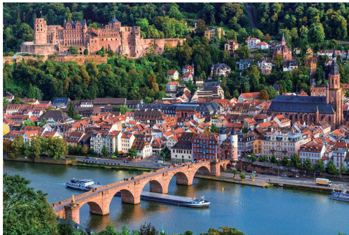
海德堡老城风景（城堡与老桥）

海德堡大学的校园是开放式的，与城市融为一体，步行街的旁边可能就是某一个学院。最主要的两个校区分别坐落于城市的老城区——内卡河南岸