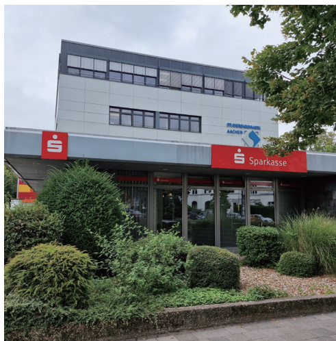
学校的食堂，前面是 Sparkasse 银行