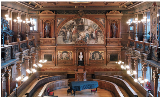
海德堡大学旧礼堂 Alte Aula

从 2017/2018 年冬季学期开始，来自非欧盟和非 EEA（欧洲经济区——冰岛、列支敦士登、挪威）国家的外国大学的国际学生申请学士和硕士课程每学期交学费 1500 欧元（在此之前是不需要的），此外每个学期还需缴纳注册费用 175 欧元，健康保险需支出 105 欧元。租房的费用需要视具体位置而定，一般单人间（15—20 平方米）的费用在 400—800 欧元不等。性价比最高的是学校提供的学生宿舍，租金（包括水电费）为每月 168—588 欧元，但是数量有限需要排队，等待 1—2 个学期也是常见的。公共交通方便，推荐购买学期票，目前的价