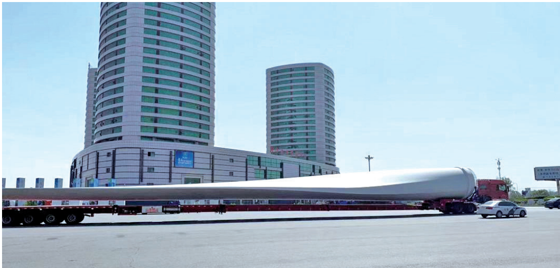
公司参与部分生产的 6.5 兆瓦发电机风叶。

投入的精力比较多,从店铺选址、装修到食材选择等各方面都反复尝试、精心安排,不负所望的是营业后店里每天都顾客爆满,第一个月流水就达到 25 万元人民币,虽然很累但很充实。”