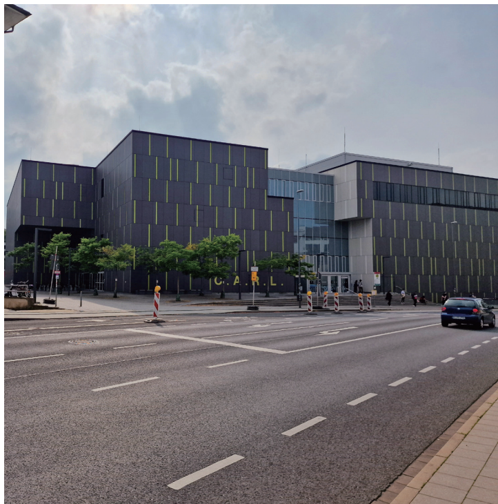
| C. A. R. L 教学楼和学习室

在亚琛，住宿是最好解决的，因为学校提供了大量的学生公寓，大多数都很新，而且住宿体验很好，都是单人间，配有厨房，可以做饭。当然，亚琛也有很多出租房可以选择，房屋配置也不错（比如很多公寓都会有独立客厅和大沙发），价格平均