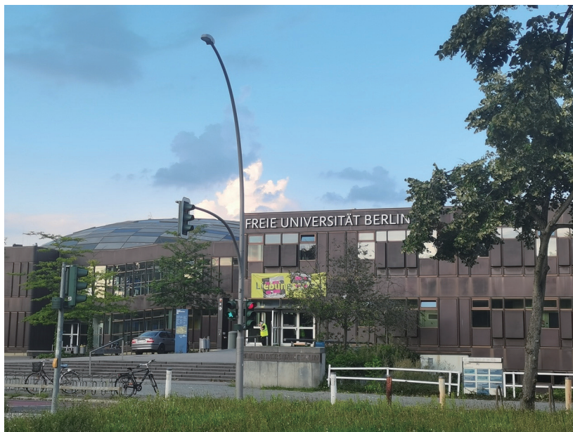
柏林自由大学正门

了众多博物馆、艺术馆和历史遗址。柏林人自己把柏林称为“既穷又性感”。作为德国最大的城市，繁华与破旧、安静与喧闹、性感与保守等种种对立面，你都能在柏林找到。柏林自由大学位于柏林西南部，周边环境安静、宜居，同时交通便利，前往市中心很方便，这样的位置对学术研究和都市生活