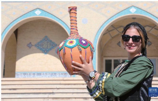
◀ 在伊朗首都德黑兰，一名身着传统服饰的女子展示手工艺品。