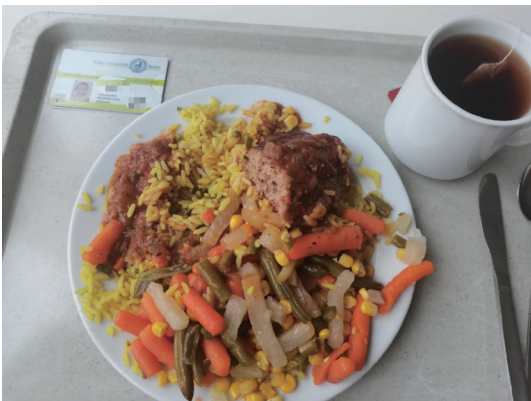
柏林自由大学食堂德式菜肴