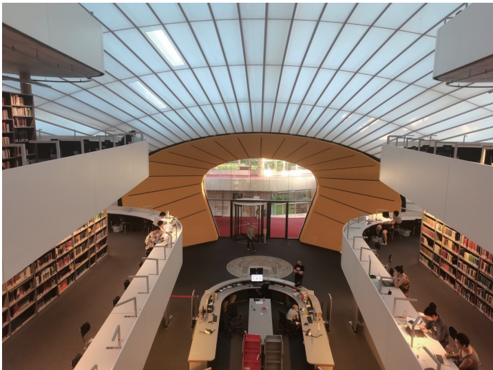
柏林自由大学语言学图书馆